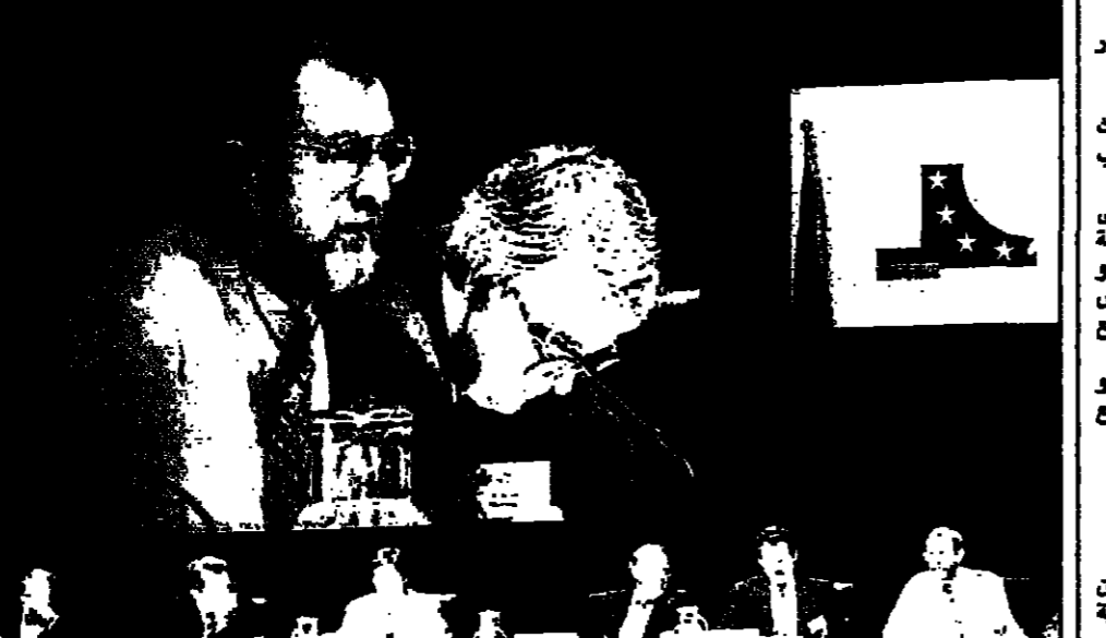
مجموعة من جلسة الإنتاج بوزارة بريس في بون ويستمر يومين بمشاركة 40 زعيما من دول الاتحاد الأوروبي وأمريكا وكندا حول سبل تنظيم التجارة عبر شبكة الانترنت

القاهرة- رويترز: أعلنت الشركة القابضة للصناعات التجماعية في مصر امس الاثنين عن رغبتها في بيع شركة الفرأفريت والادوات المكتبية التابعة لها في إطار برنامج الخصخصة. وقالت الشركة القابضة للصناعات التجماعية في مصر امس الاثنين عن رغبتها في بيع شركة الفرأفريت والادوات المكتبية التابعة لها في إطار برنامج الخصخصة.